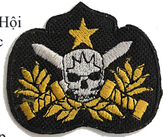
Huy hiệu vai của Biệt Động Đội, 1960

Tháng 7 năm 2022, Tổng Hội Biệt Động Quân đã tổ chức long trọng Đại Hội Biệt Động Quân Lần Thứ 62 tại San Jose, California, Hoa Kỳ; đồng thời Kỷ Niệm 62 Năm Thành Lập Binh Chủng Biệt Động Quân. Trong dịp này Chiến Sử Biệt Động Quân cũng đã được chính thức phát hành sau một thời gian dài sưu tầm và khảo cứu.