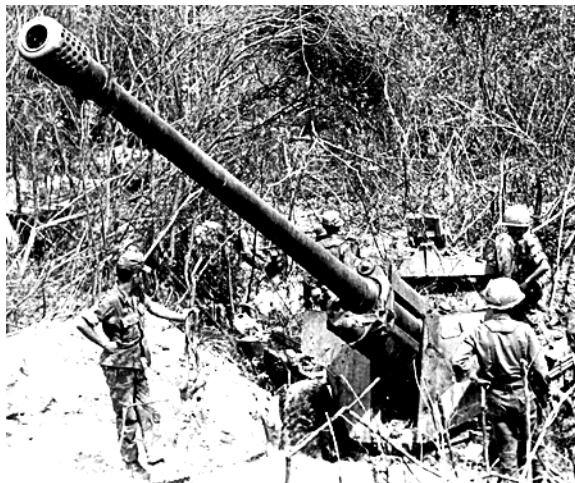
130 ly của VC bị tịch thu tại mặt trận Quảng Trị, 1972.

Ngày 14/4, cuộc hành quân phản công nêu trên bắt đầu khởi sự nhưng được đổi danh xưng thành Lam Sơn 729. Lần này mục tiêu dự trù chiếm lại sẽ nhiều hơn như: Căn cứ Holcomb, Mai Lộc, Tân Lâm