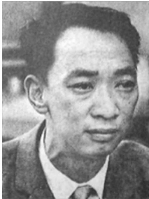
Tướng Nguyễn Ngọc Loan

Người ta gọi ông với cái tên bình dân: “Anh Sáu Lèo”, Ông là gốc KQ, một cấp nhí TQLC như tôi thì làm sao dám lại gần ông Tướng Cảnh Sát, nhưng Đại Đội tôi bị biệt phái theo ông nên thường bị ông chỉ mặt đặt tên. Lúc nào ông cũng mặc áo giáp để phanh ngực và ít khi đội mũ, phơi cái trán hói trước súng đạn,