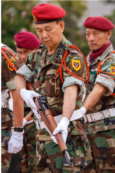
Súng Mặc Niệm August 25, 2018 Nam California

Chương trình Văn Nghệ đấu tranh lôi cuốn quan khách đến gần nửa đêm. Rất nhiều người đã ở lại đến giây phút sau cùng.