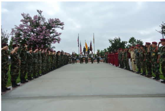
Tiên Quốc Quân Kỳ tại Đài Tưởng Niệm Chiến Sĩ Việt Mỹ Nam California

8122 Legion Place, Midway City, Ca.92655