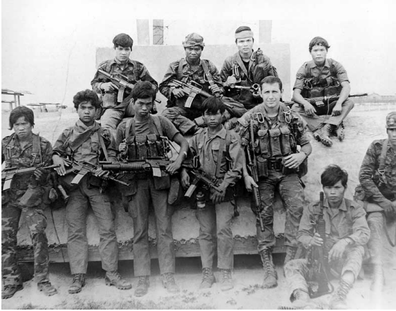
một đơn vị Mike Force

súng cách nơi tôi đóng quân khoảng 500 mét. Sau quả đạn 105 li đầu, tôi báo đã chính xác, trại Ben Het bắn thêm 10