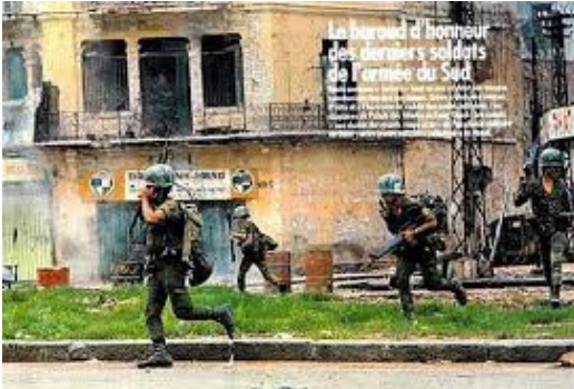
BDQ tại Sài Gòn