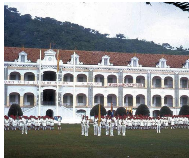
Các Thiếu Sinh Quân VNCH đã cố thủ tại Trường Mẹ cho đến hơi thở cuối cùng của VNCH