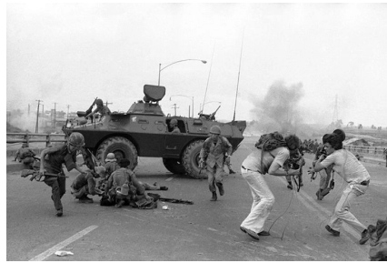
Chận Dịch tại cầu Tân Cảng Sài Gòn