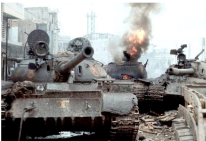
Tank CSBV bị bắn cháy tại ngã tư Bàng Hiền Sài Gòn